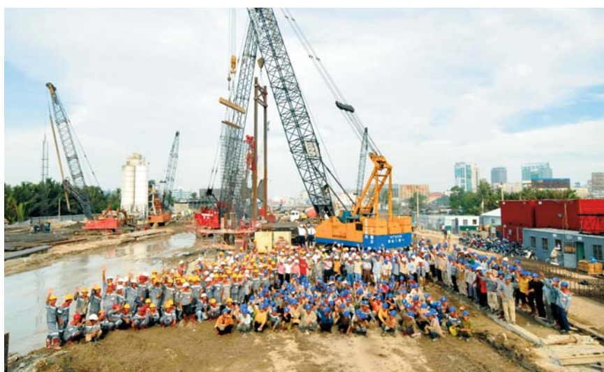
Équipe de chantier de Thu Thiem