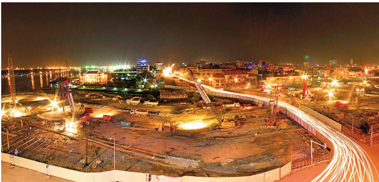
Équipe de nuit côté Ho-Chi-Minh-Ville

Construction de deux voies d'accès en tranchée couverte de chaque côté d'un tunnel passant sous la rivière Saigon