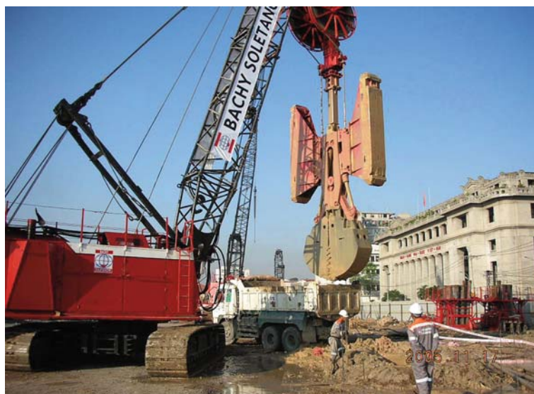
La benne preneuse à ouverture de 5 mètres conçue spécialement pour le projet