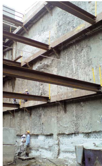
Paroi moulée butonnée côté Thu Thiem

Une benne hydraulique (KS) a été pourvue d'une coquille de 5,0 x 0,8 spécialement conçue pour cette mission afin de permettre l'excavation de barrettes de 5 m en une seule passe.