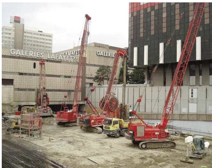
Benne hydraulique KS2 en cours d'excavation