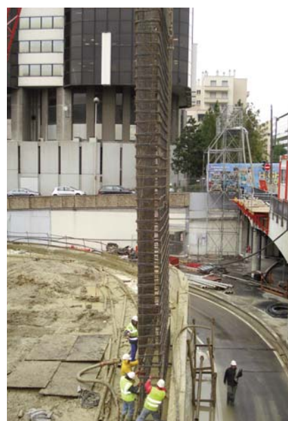
Equippedement des armatures