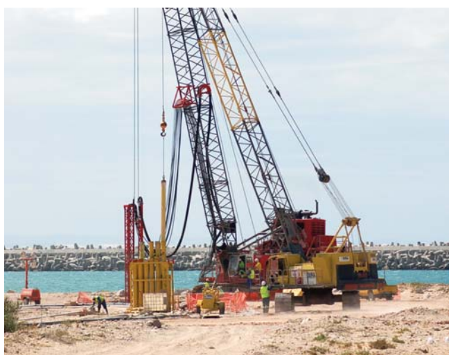
Hydrofraise HF 4000

L'épaisseur de la paroi est de 0,60 m et sa perméabilité de l'ordre de 10^{-8} m/s à 28 jours.