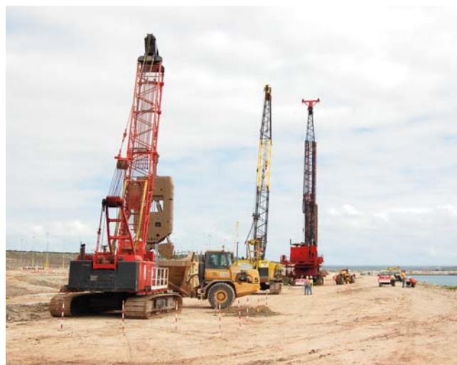
Vue générale du chantier phase 2