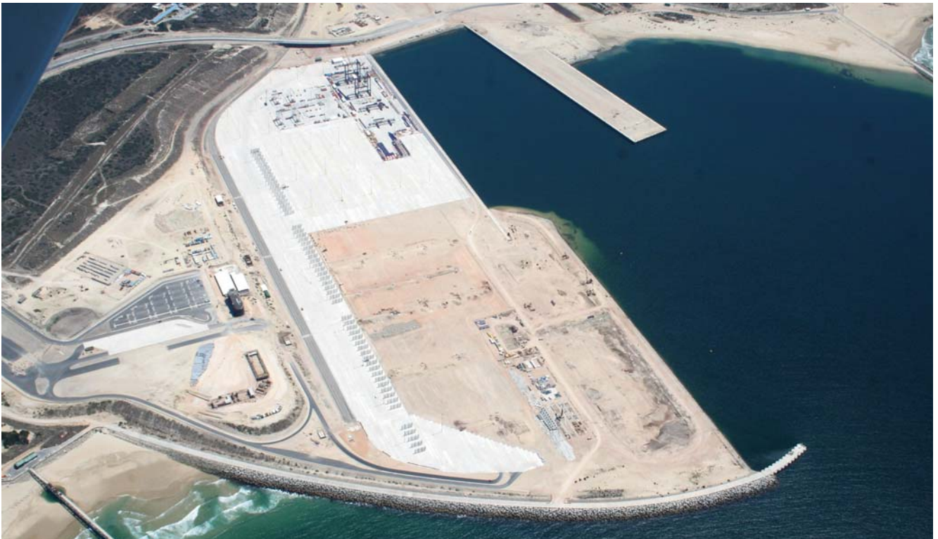
Vue aérienne du site phase 2

Ecrans étanches en paroi au coulis et en béton plastique pour permettre la construction d'un mur de quai