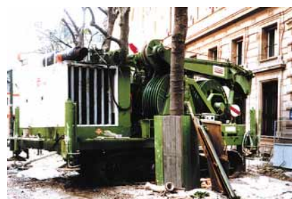
Hydrofraise latine en service

Les tubes sont appuyés sur des chevêtres reposant d'un côté sur les poteaux profonds et de l'autre sur le sol. Puis des dalles préfabriquées sont glissées sous les tubes et prennent appui sur la paroi moulée ; vient enfin la réalisation du réseau de poutres longitudinales et transversales de la dalle.