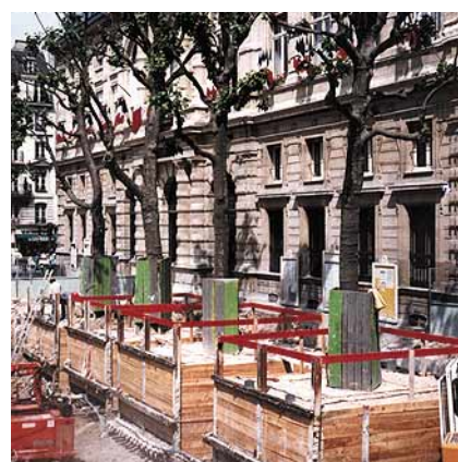
Reprise en sous-œuvre des arbres