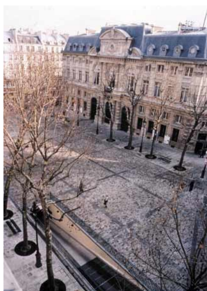
Vue de la place Baudoyer pendant et après les travaux

La paroi moulée est ancrée par un lit de tirants provisoires précontraints pour permettre le terrassement au fond de fouille, tandis que les poteaux profonds maintiennent en place les bacs à arbres.