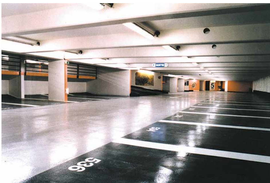
Vue du parking

La paroi a été réalisée à l'Hydrofraise latine, outillage le mieux adapté à la traversée de terrains durs (calcaire grossier) tout en préservant les ramures