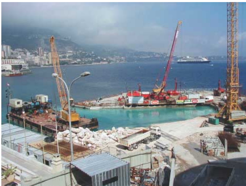
Vue générale du chantier

La stratigraphie est la suivante : - Remblais vibro-compactés (ballast) de -30 à -40 NGM environ. - Argiles sableuses molles (zones non purgées) et tufs calcaires modérément durs de -40 à -45 NGM. - Alternance de sables calcaires et limons argileux de -45 à -60 NGM.