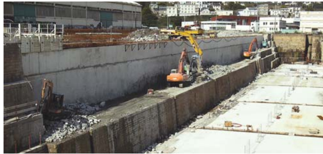
Démolition du bajoyer et construction de la poutre de couronnement