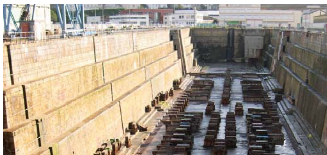
Forme de radoub avant travaux