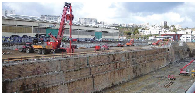
Réalisation de la paroi moulée