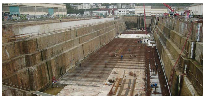
Construction du nouveau radier