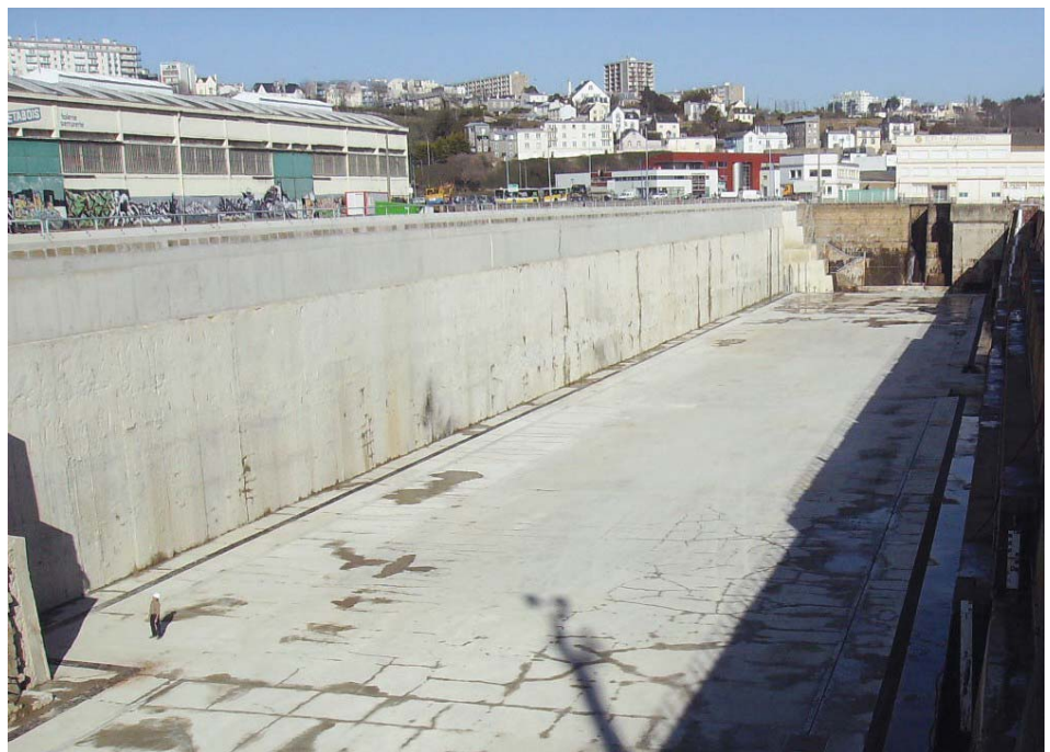
Forme de radoub après travaux

Grâce à ces travaux financés en partie par la Région Bretagne, la Communauté Européenne et l'Etat, la Chambre de Commerce de Brest souhaite passer de 145 à 245 jours d'occupation de la Forme par an.